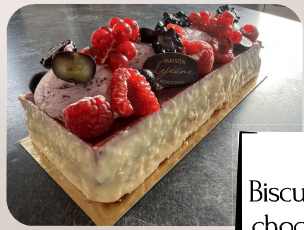
Le Berry : Biscuit madeleine, croquant au chocolat blanc, compotée aux fruits rouges, mousse myrtilles, décor fruits.