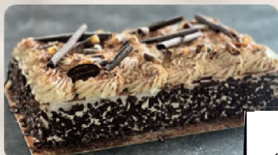
Côte d'opale : Génoise chocolat, crème chocolat.