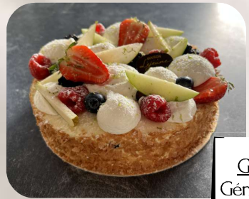
Génoise Fruits assortis Génoise, crème mousseline, fruits de saison assortis.