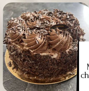
Le Merveilleux : Taille unique : 6/8 pers. Meringue, crème parfum au choix : chocolat, café, spéculoos, citron, framboise, pistache.

N'hésitez pas à nous consulter pour les prix et tailles de nos gâteaux.