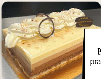
Le 3 chocolats : Biscuit amande, croquant praliné, mousse chocolat noir, lait et blanc.