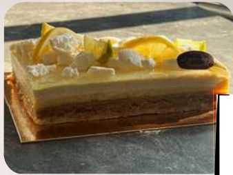
L'Odéci : Biscuit amande et citron, confit de citrons, crémeux vanille, mousse aux deux citrons.

Au fil des saisons, découvrez également nos gâteaux et entremets éphémères. La sélection est disponible en boutique.