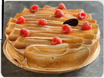
Capitole : Génoise, crème diplomate, framboises, meringue italienne.