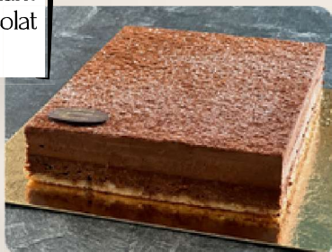
Le Royal : Biscuit amande, croquant praliné, mousse chocolat noir.