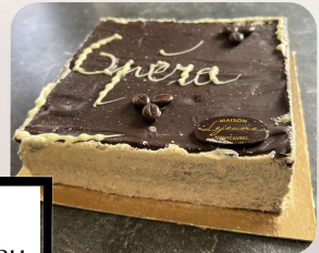
Opéra : Génoise chocolat, crème au beurre café, ganache chocolat noir.