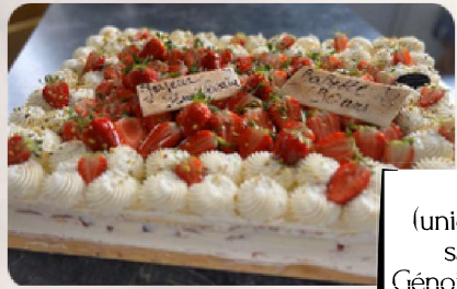
Génoise Fraises (uniquement pendant la saison des fraises) Génoise, crème mousseline, fraises fraîches.