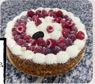
Génoise Framboises Génoise, crème mousseline, framboises.